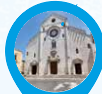
2. Cattedrale San Sabino