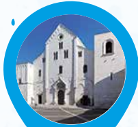
1. Basilica San Nicola