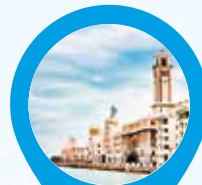
6. Lungomare di Bari